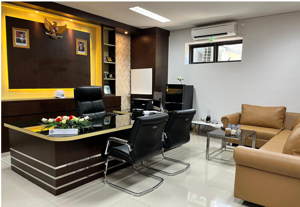
Gambar 1. Ruang Direktur DPPK UNY

DPPK merupakan direktorat baru sehingga perlu menata sarana dan prasarana yang ada. Ruang Direktur dan Sekretaris Direktorat belum ada maka untuk meningkatkan layanan perlu dilakukan renovasi ruang Direktur DPPK dan Sekretaris DPPK yang dilaksanakan pada rentang waktu Mei sampai dengan Oktober 2023, melalui anggaran bersama rektorat. Berikut adalah gambar Ruang Direktur dan Sekretaris Direktorat DPPK UNY.