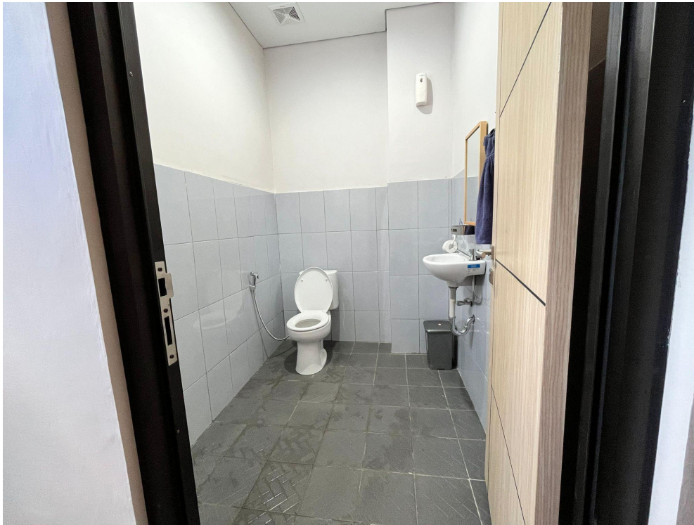
Gambar 4. Kamar mandi Ruang Sidang