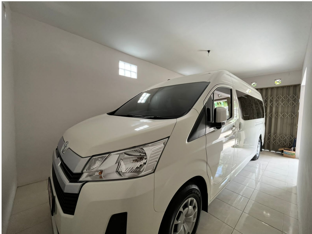
Gambar 5. Penambahan Mobil Operasional DPPK