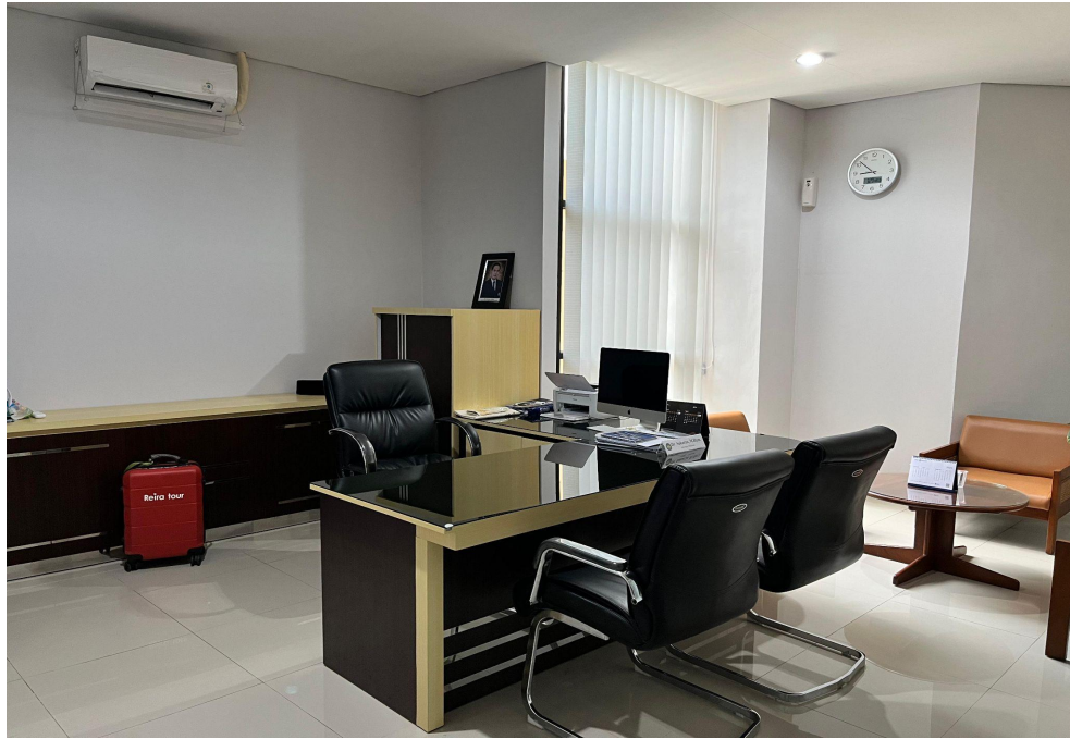
Gambar 2. Ruang Sekretaris Direktorat DPPK UNY