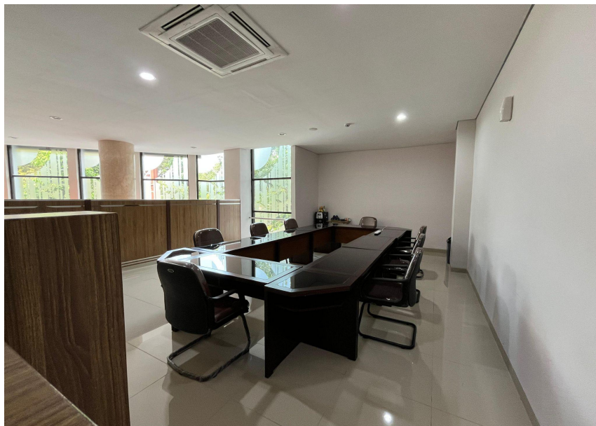
Gambar 3. Ruang Transit Dosen DPPK UNY

DPPK merupakan direktorat baru sehingga perlu menata sarana dan prasarana yang ada. Dengan adanya penataan Ruang Direktur yang sebelumnya digunakan sebagai ruang transit dosen, maka ruang transit dipindahkan ke lantai 2 dengan memanfaatkan ruang yang kosong untuk disekat menjadi ruang transit dosen yang dilaksanakan pada rentang waktu Mei sampai dengan Oktober 2023, melalui anggaran bersama rektorat. Berikut adalah gambar Ruang Transit Dosen DPPK UNY.